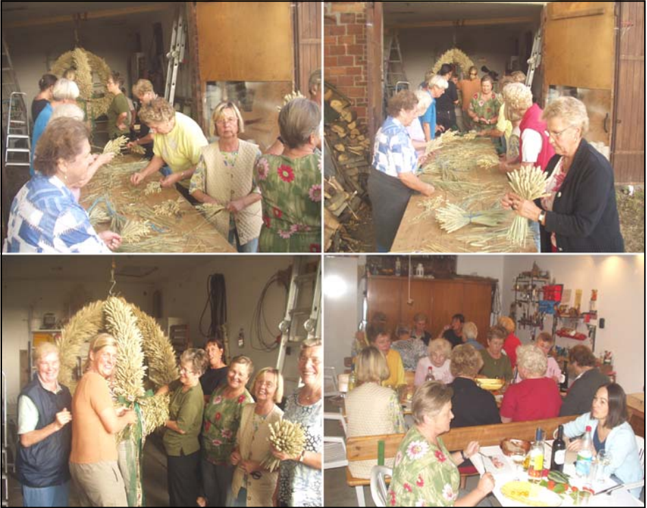
Mit viel Hingabe und Konzentration wird die Erntekrone geflochten

Endlich ist es so weit: Auch in unserer Martinskirche hängt seit dem Erntedankfest eine wunderschöne Erntekrone!