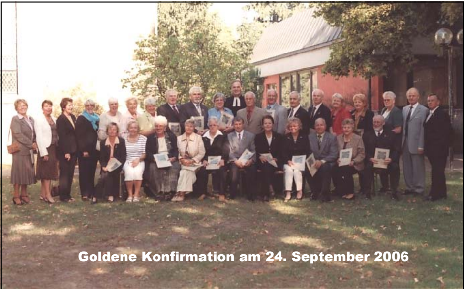
Goldene Konfirmation am 24. September 2006