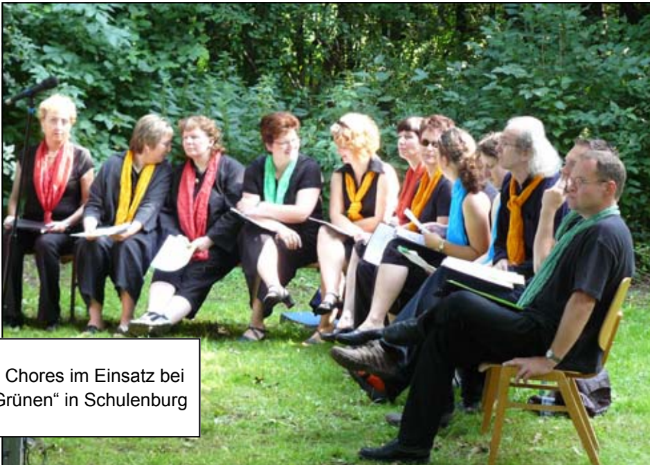
Ein Teil des Chores im Einsatz bei „Kirche im Grünen“ in Schulenburg