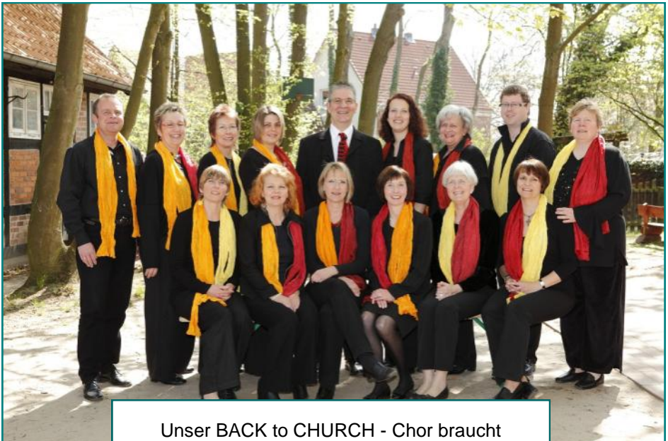
Unser BACK to CHURCH - Chor braucht Verstärkung und sucht neue Mitglieder

Ab dem 2. August findet der Seniorentreff der AWO zum Klönen und Kartenspielen montags und (mit Einschränkungen) mittwochs von 14.30 bis 18 Uhr im Gemeindehaus unserer Kirchengemeinde statt.