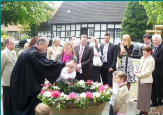
Taufe im Grünen am Pfingstsonntag