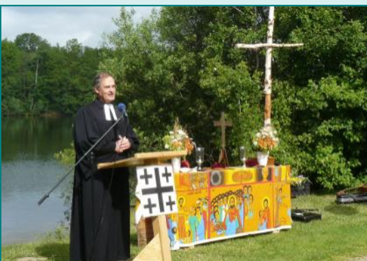
Kirche im Grünen in Schulenburg

Herzlichen Dank dem MTV für das Verleihen der Torwand und der Bänke sowie dem Ortsrat Schulenburg für eine Kiste Bier!