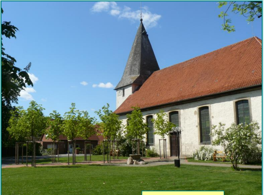
Unsere neue Lindenallee