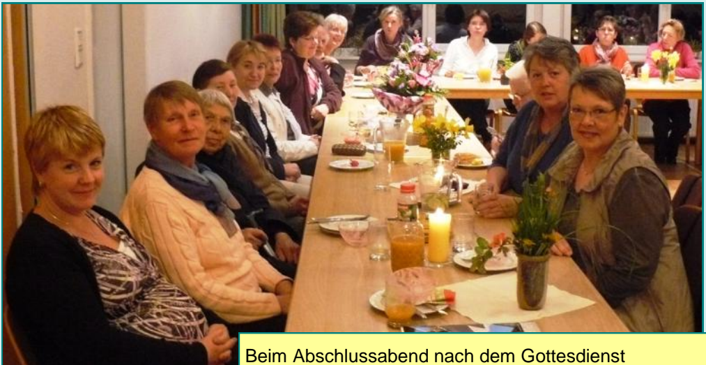
Beim Abschlussabend nach dem Gottesdienst