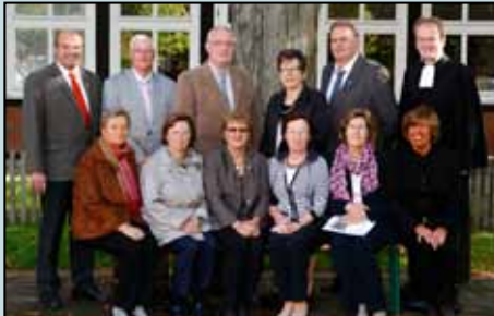
Goldene Konfirmation 30. September 2012

Nach dem festlichen Abendmahlsgottesdienst und einem Sektempfang im Gemeindehaus blieben noch viele Jubilare zum Mittagessen in der Gaststätte Tegtmeyer und ließen den Tag dann mit einem Kaffeetrinken im Gemeindehaus und einer Abschlussandacht in der Kirche ausklingen.