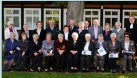
Eiserne Konfirmation 30. September 2012

Am letzten Sonntag im September, am 30.9., fand in der Martinskirche wieder die Jubelkonfirmation statt. Dazu sind Konfirmanden zum Teil von weit her nach Engelbostel gefahren, die in diesem Jahr ihre Goldene, Diamantene oder Eiserne Konfirmation gefeiert haben; vor fünfzig, sechzig bzw. fünfundsechzig Jahren