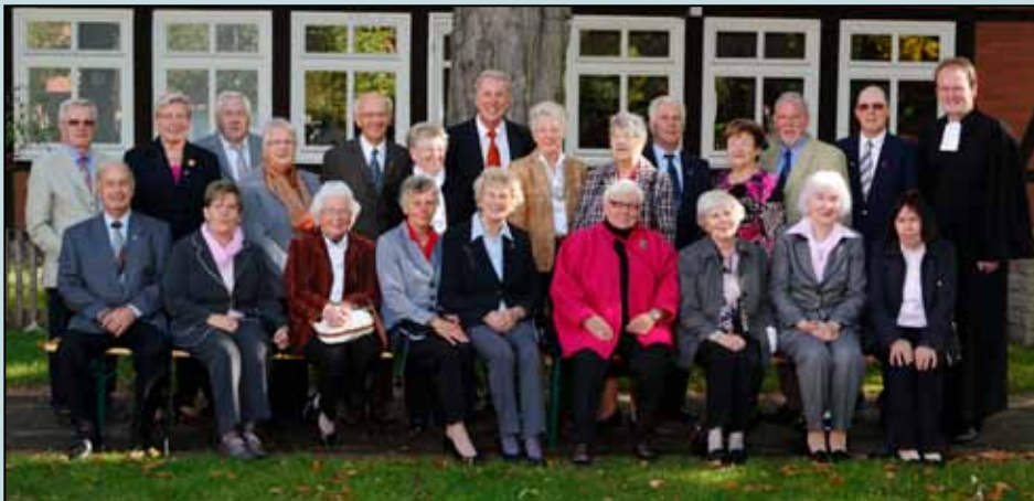
Diamantene Konfirmation 30. September 2012

Der Hospizverein Langenhagen wurde 1992 gegründet.