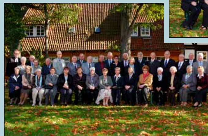
Diamantene Konfirmandinnen und Konfirmanden