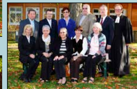
Goldene Konfirmandinnen und Konfirmanden