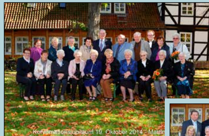
Eiserne Konfirmandinnen und Konfirmanden

Diese haben am vorletzten Sonntag vor dem Reformationstag, am 19. Oktober, ihren Glauben erneuert und sich an ihre Konfirmationen in den Jahren 1964, 1954 und 1949 erinnern lassen. Allen, den jungen und den alten Konfirmandinnen und Konfirmanden, wünschen wir alles Gute und Gottes Segen für ihren Weg mit Gott!