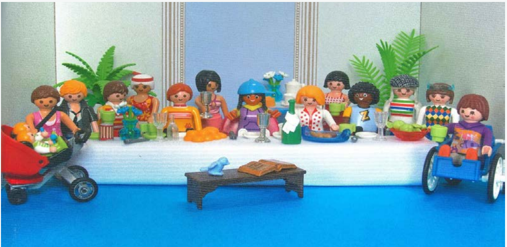
Das große Gastmahl

Jesus Christus spricht: „Wenn du ein Mahl machst, so lade Arme, Verkrüppelte, Lahme und Blinde ein, dann wirst du selig sein, denn sie haben nichts, um es dir zu vergelten!“ Lukas 14,13