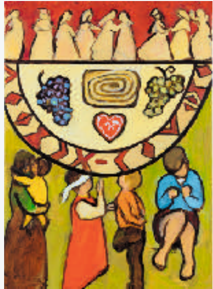
Motiv: Rezka Arnuš © Weltgebetstag der Frauen - Deutsches Komitee e.V.

In rund 120 Ländern weltweit rufen ökumenische Frauengruppen über Länder- und Konfessionsgrenzen hinweg zum Mitmachen am Weltgebetstag auf. Seit mehr als 100 Jahren macht die Bewegung sich stark für die Rechte von Frauen und Mädchen in Kirche und Gesellschaft. Am 1. März werden allein in Deutschland hundertausende Frauen, Männer, Jugendliche und Kinder die Gottesdienste und Veranstaltungen besuchen. Gemeinsam setzen sie am Weltgebetstag 2019 ein Zeichen für